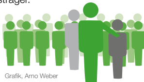
Grafik, Arno Weber

Es gibt Kooperationen mit Leistungsträgern der beruflichen Integration z. B. Agentur für Arbeit, dem Jobcenter, Arbeitsvermittlungsstellen, betriebliche/ außerbetriebliche Berufsausbildungsstätten, Schulen/ Fachschulen und den zuständigen Berater:innen der Rentenversicherungsträger.