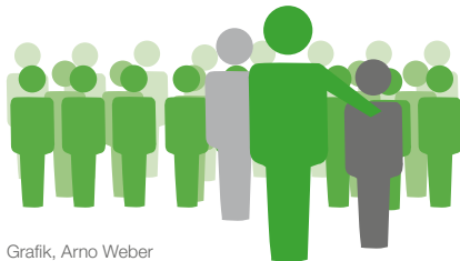
Grafik, Arno Weber

Es gibt Kooperationen mit Leistungsträgern der beruflichen Integration z. B. Agentur für Arbeit, dem Jobcenter, Arbeitsvermittlungsstellen, betriebliche / außerbetriebliche Berufsausbildungsstätten, Schulen/ Fachschulen und den zuständigen Berater*Innen der Rentenversicherungsträger.