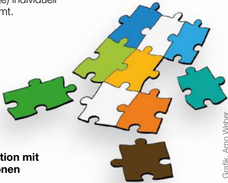
Grafik, Arno Weber

Innerhalb des Verbundsystems (Netzwerk Suchthilfe gemeinnützige GmbH und Arbeitskreis für Jugendhilfe e.V.) besteht eine Kooperation mit den ambulanten und stationären Einrichtungen. Im Verbund der träger-eigenen Fachklinik Release wird die Gesamtbehandlung (Entwöhnung, Adaption und Nachsorge) individuell abgestimmt.